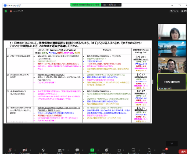
(受講生によるグループワーク報告)